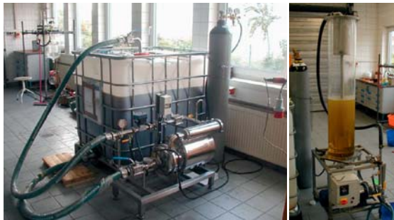
Abb. 3: Versuchsanlagen

Abb. 4 zeigt exemplarisch den Sauerstoffgehalt eines Leinöles als Funktion der Behandlungsdauer. Es gelang, den Sauerstoffgehalt von 32 mg O 2 / kg Öl innerhalb von 12 min auf 0,5 mg O 2 / kg Öl zu senken. Der spezifische Stickstoffverbrauch lag bei ca. 0,1126 g/kg Öl · min und lässt sich durch technologische Maßnahmen noch senken.