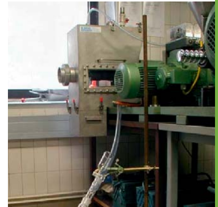
Abb. 1: Eingehauste Presse

Eine Möglichkeit besteht in der Einhausung einer Presse und Begasung des gesamten Systems mit Stickstoff beim Pressvorgang. Dies wurde experimentell überprüft. Abb. 1 stellt den Versuchsaufbau dar. Es wurden Raps- und Leinöl unter Schutzgasatmosphäre gewonnen. Es zeigte sich, dass sowohl das Einschleusen der Saat als auch das Ausschleusen von Öl und Presskuchen zu hohen Verlusten an Stickstoff führen und dabei das Eintreten von Sauerstoff (z.B. mit der Saat) nicht vollkommen verhindert werden kann. Als Ergebnis ist zu konstatieren, dass es mit dieser Methode nicht gelingt, Sauerstoffkonzentrationen von 2 mg O 2 / kg Öl zu unterschreiten.