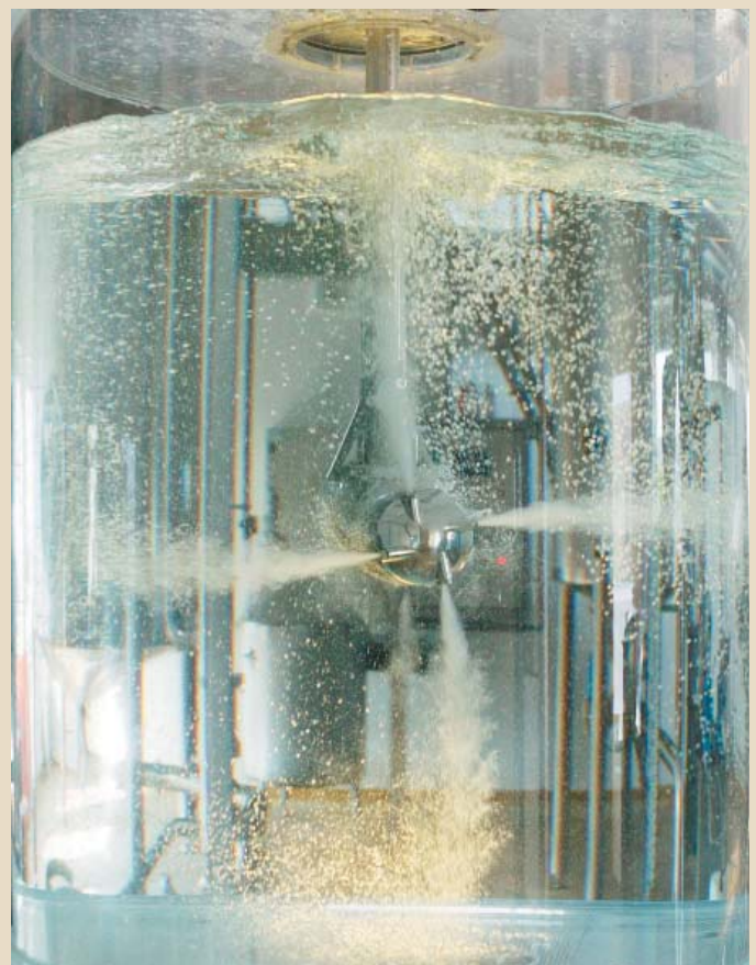
Abb. 3 Optimale Durchmischung der Flüssigkeit

Durch die Iso-Mix-Technologie eröffnen sich den Brauereien und der Getränkeindustrie neue Möglichkeiten. Sie steht für ein sehr einfaches, aber sehr innovatives System, das vielfältige Einsatzmöglichkeiten bietet. Nicht umsonst lautet das Motto von Iso-Mix „Mischen mit Köpfchen“.