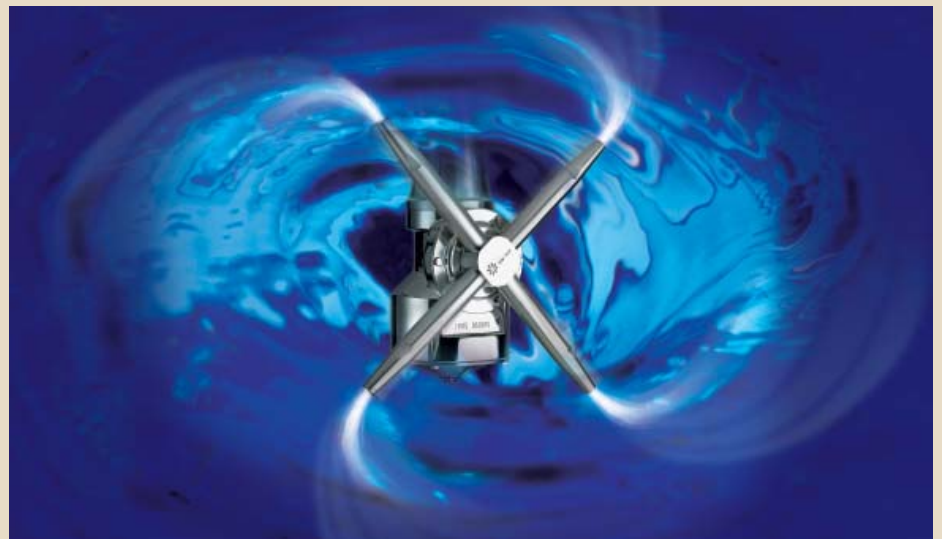
Abb. 1 Routierender Sprühkopf

Ein großer Vorteil ist, dass man die Technik ohne großen Aufwand in einen vorhan-